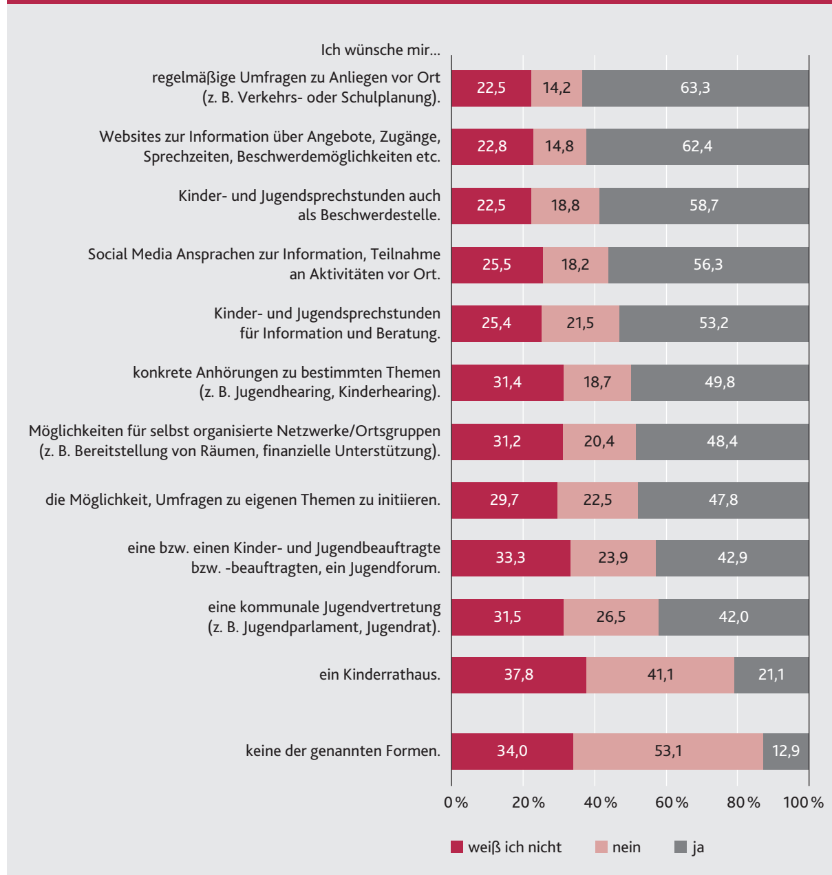
Abbildung 1: Wünsche nach Beteiligungsformen am Wohnort, Angaben in Prozent